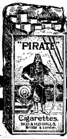
PIRATE Cigarettes W.D. & H.O. WILLS

凡最好物件已暢銷於社會，往往有以假亂真，魚目混珠者。近時雖有假冒者出現，不久即行銷滅。未能如刀牌之能，永久暢銷。因刀牌係英國比司徒及倫敦威爾司廠監製，並由天下馳名之英美烟公司專售。